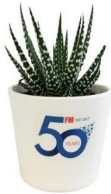
Mini plante dépolluante dans un pot en céramique, made in France

De plus, votre interlocuteur sera sensible à votre volonté de défendre les valeurs auxquelles il est également attaché : vous créez ainsi un lien de connivence .